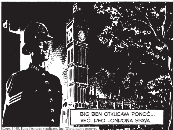
„BIG BEN OTKUČAVA PONOČ... VEĆI DEO LONDONA SPAVA...“

„IDITE SVE U PERŠUN! KLADIM SE DA ČU IZAĆI VEČERAS... A AKO ME NEKA OTKUČA, ZAŽALIĆE!“